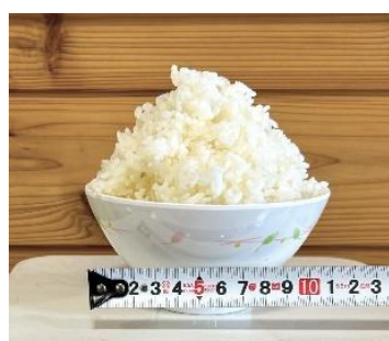
1 合 (通常提供)