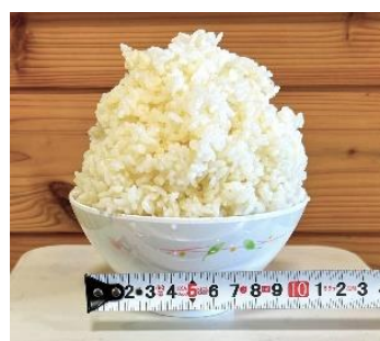
1.5 合 (0.5 合増量)