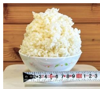
1.5 合 (0.5 合増量)