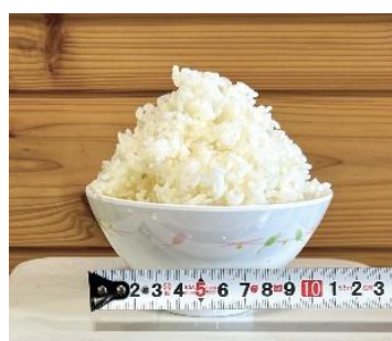
1 合 (通常提供)